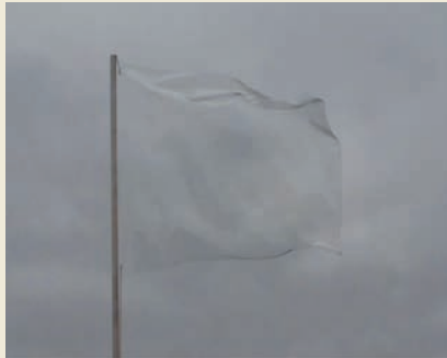
Edith Dekyndt, One Second Of Silence (Rotterdam) , 2009. Collection FRAC Alsace.

Lafayette et la liberté , une exposition autour de la figure de Lafayette et de la naissance de la Démocratie en France et aux États-Unis.