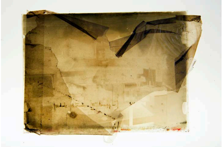
Station de sismologie (vue de l'intérieur), plaque de verre négative, vers 1910, photographie sur table lumineuse, 2019.

L'exposition monographique d'Arno Gisinger établit un dialogue entre la photographie, l'histoire des sciences et l'art sonore en transformant le bâtiment du FRAC Alsace en instrument d'expérience visuelle et physique. Comment représenter l'invisible ?