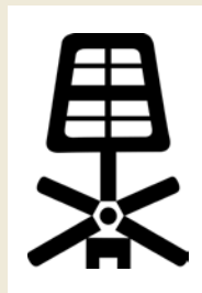
Laure Tixier, Map with a view - Géométrie de l'enfermement, Prison de la Santé, Paris, France (1867), 2014, Collection FRAC Alsace

Retrouvez les collections des FRAC du Grand Est sur Instagram @lesfracgrandest